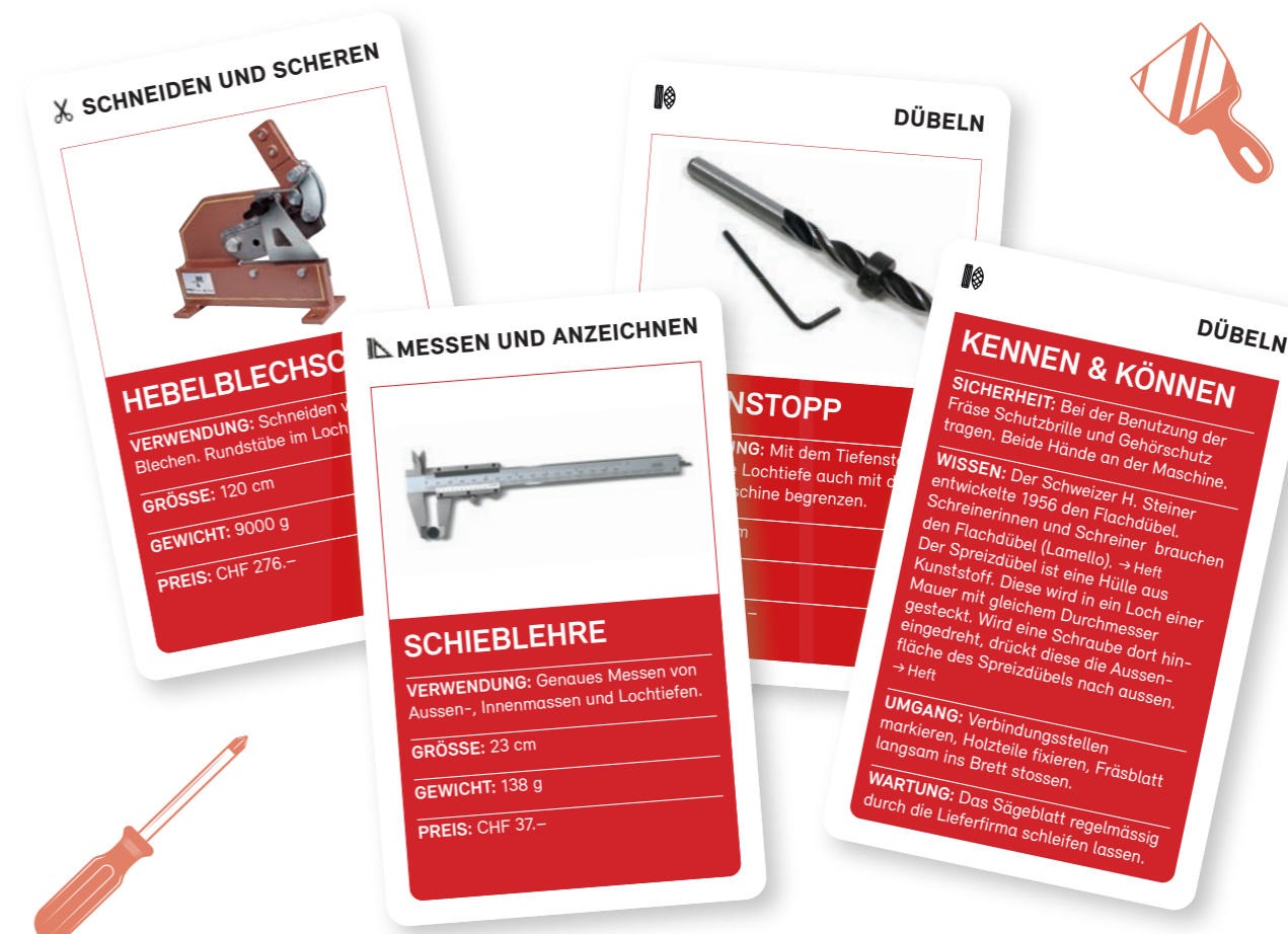
Thomas Stuber Technik und Design Kartenspiel Werkzeuge

1. Auflage 2022 | 67 Karten in Schachtel | ISBN 978-3-0355-2054-5 | CHF 26.-